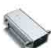
WA25 attacco pivotante per aste rettangolari fino a 4m