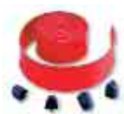
WA2 confezione 8m gomma protettiva antiurto rossa completa di tappi di chiusura per asta WA1