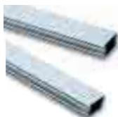
WA22 asta componibile, con giunto di unione, in alluminio verniciato 36x94x3125mm bianco