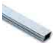
WA21 asta in alluminio verniciato bianco 36x94x6250mm