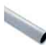
WA7 asta in alluminio tubolare verniciato bianco Ø90x6250mm per applicazioni in presenza di forte vento, solo con WA11