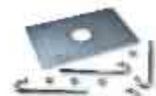
WA16 base di ancoraggio con zanche