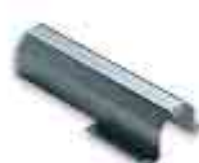
WA4 attacco per asta WA3