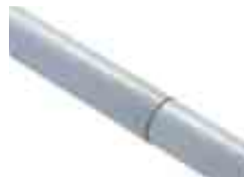
WA24 asta tubolare telescopica in alluminio verniciato bianco, lunghezza max. 8,5m, completa di appoggio mobile WA12, contrappeso e attacco. Ingombro per il trasporto 6m. Vedi disegno pagina 61