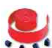
WA6 confezione 12m gomma protettiva antiurto rossa completa di tappi di chiusura per asta WA21, WA22