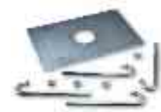
WA15 base di ancoraggio con zanche