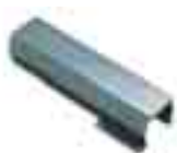
WA8 attacco per asta WA7