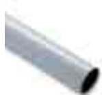
WA3 asta in alluminio tubolare verniciato bianco Ø70x4250mm, per applicazioni in presenza di forte vento.