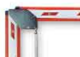
WA14 snodo per aste WA1 (da 1850mm a 2400mm)