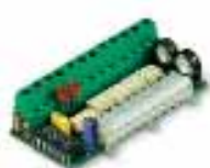
PIU scheda espansione funzioni per la centrale di comando Pz./conf. 1