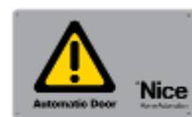
TS tabella segnaletica Pz./conf. 1