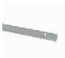
ROA8 cremagliera M4 30x8x1000mm zincata, completa di viti e distanziali Pz./conf. 10