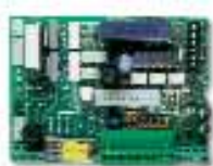
THA6 centrale di ricambio, solo scheda per TH2251