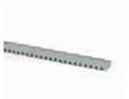
ROA7 cremagliera M4 22x22x1000mm zincata Pz./conf. 10