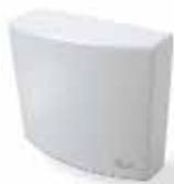
A02 centrale di comando con chiusura automatica