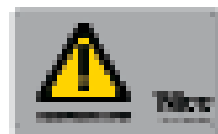
TS tabella segnaletica