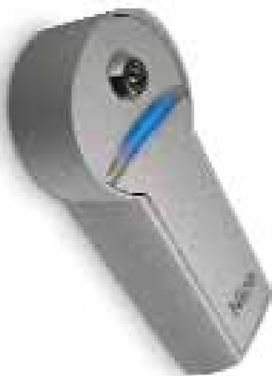
KIO selettore a chiave per contatti in bassa tensione con meccanismo di sblocco per fune metallica