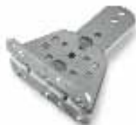
PLA14 staffa posteriore regolabile da avvitare