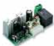
CARICA scheda a innesto per caricabatterie solo per A824