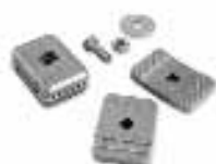
PLA13 finecorsa meccanici per apertura e chiusura