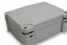
BA3-A box Nice per batterie