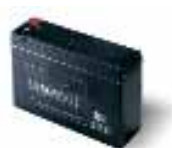
B12V-C batterie 12V 2Ah