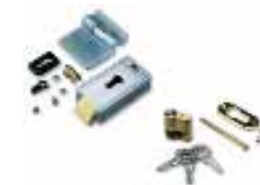
PLA10 elettroserratura 12V verticale (obbligatoria per ante superiori a 3m)