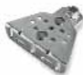
PLA15 staffa anteriore regolabile da avvitare