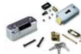
PLA11 elettroserratura 12V orizzontale (obbligatoria per ante superiori a 3m)