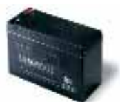
B12-B batterie 12V 6Ah