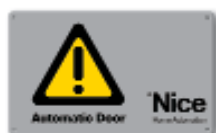
TS tabella segnaletica