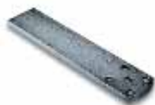
PLA6 staffa posteriore lunghezza 250mm